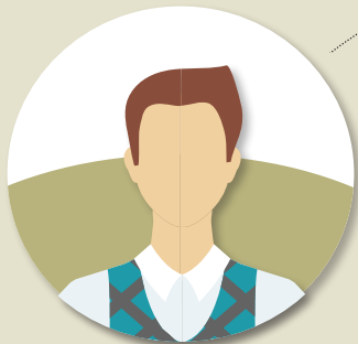
Posameznikom individualno svetovanje