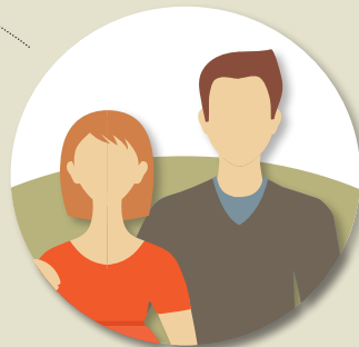
Parom partnersko svetovanje