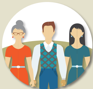
Družinam družinsko svetovanje